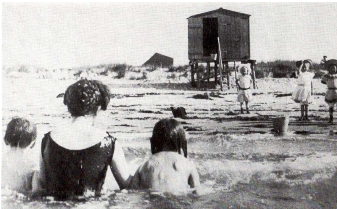
Nordstrand. Langs stranden blev i århundredets begyndelse opstillet badehuse, hvor omklædning kunne finde sted.