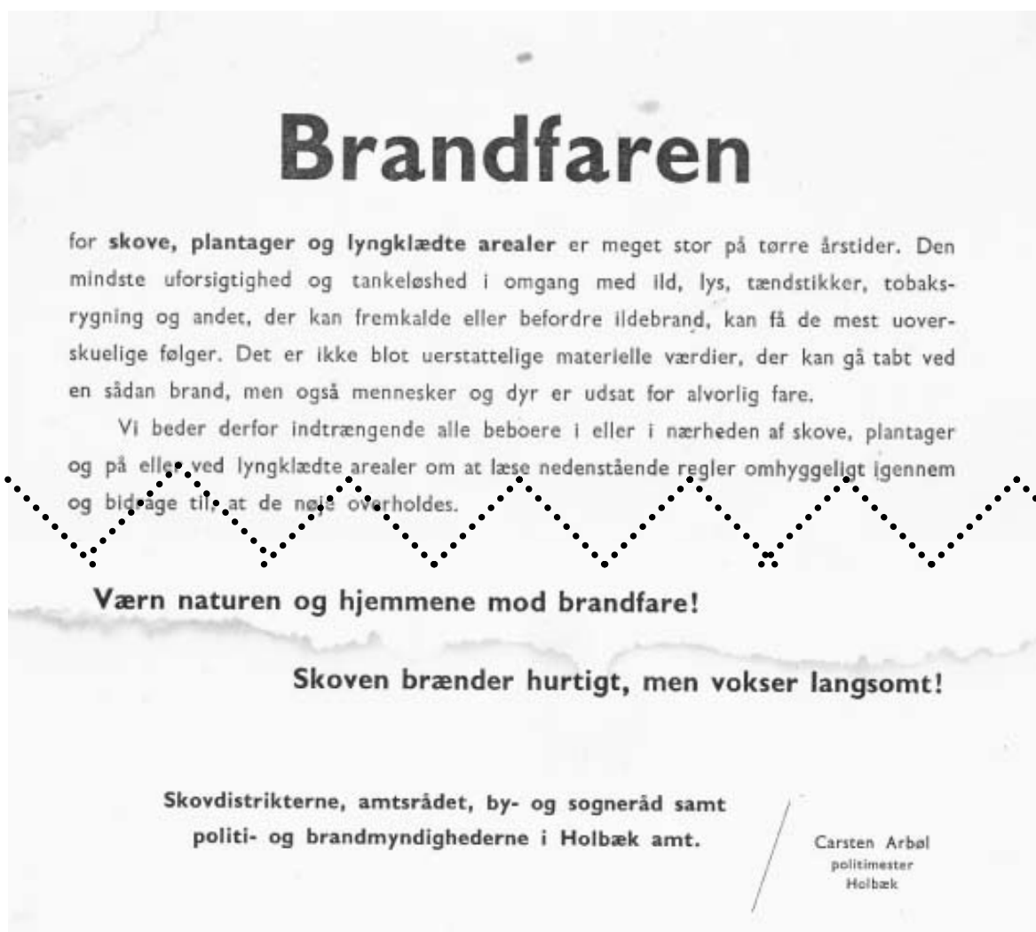
Udsnit af gode råd om brandfare – udgivet 1960

En af vore succeshistorier er generalforsamlingernes 2. halvleg, der består i, at alle fremmødte får et stykke mad og lidt vådt til ganen. Denne gode tradition blev indført i slutningen af 70-erne - i starten i form af et par stykker smørrebrød, senere som en buffet, hvilket det ikke er blevet dårligere af.